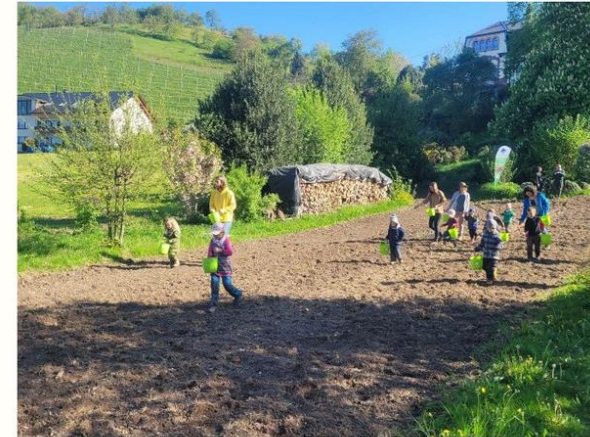
Aussaats Hauptstraße 04_2022 (Privatfläche mit Kindern des Naturkindergartens)